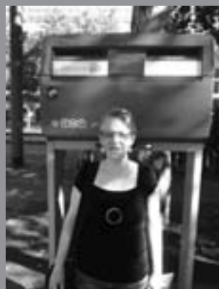
TNT verhoogt de tarieven