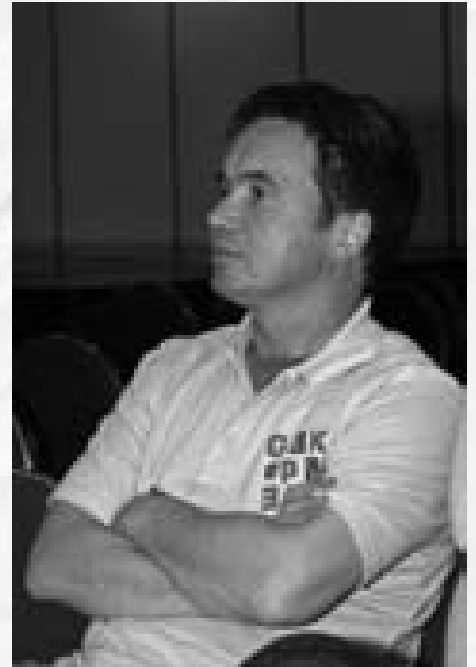
de begeleiding is gestopt.

Van de cliënten stroomden er inmiddels vijftien uit naar betaald werk. Dat wil zeggen: er is werk voor hen gevonden en