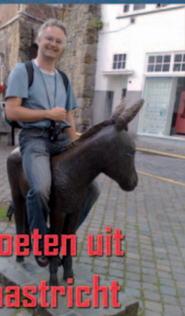
oeten uit nastricht