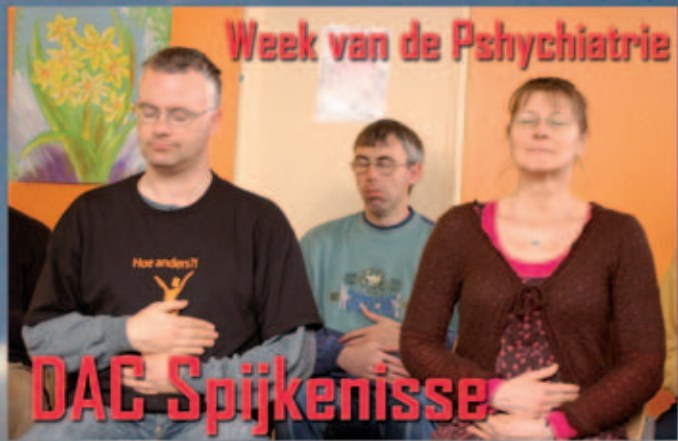
Week van de Pshychiatrie DAC Spijkenisse