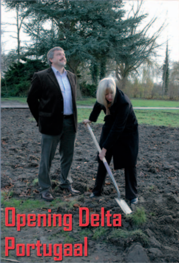
Opening Delta Portugaal