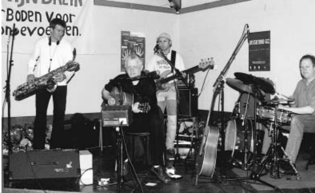
De folkband 'Watchman' stelt zich voor