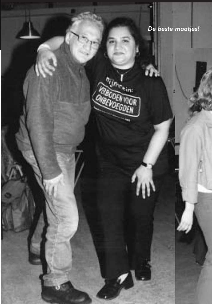
De beste maatjes!