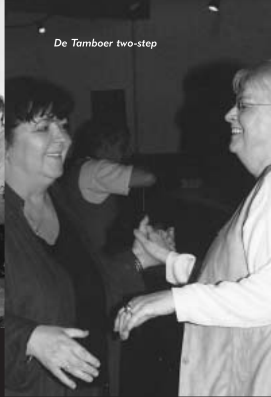
De Tamboer two-step