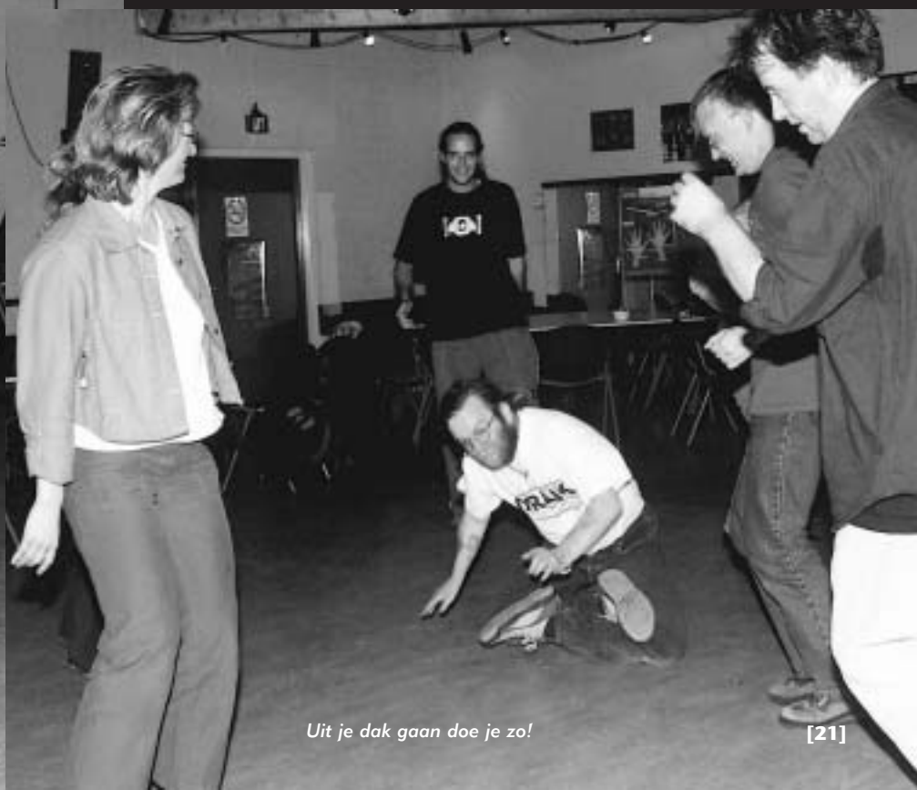
Uit je dak gaan doe je zo!